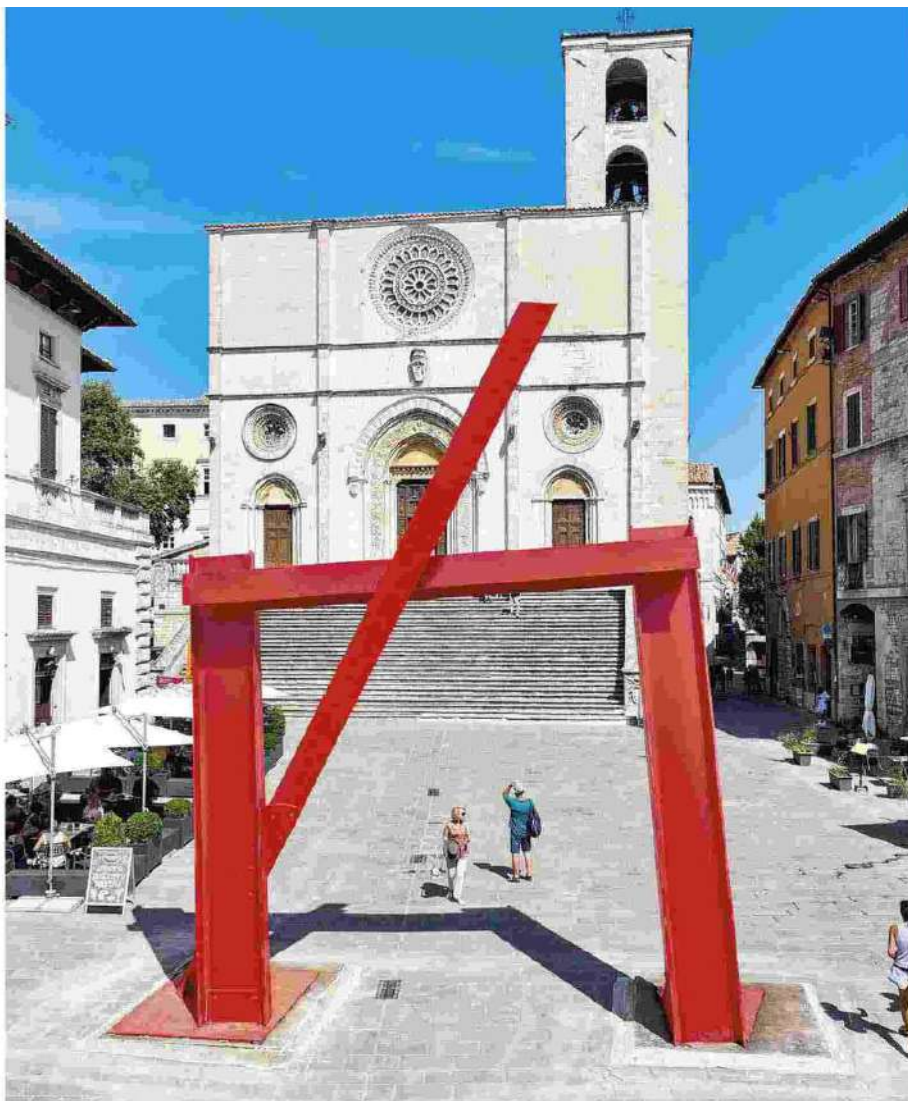
L'opera di Mark di Suvero "Neruda's Gate" (2005) installata nella piazza di Todi