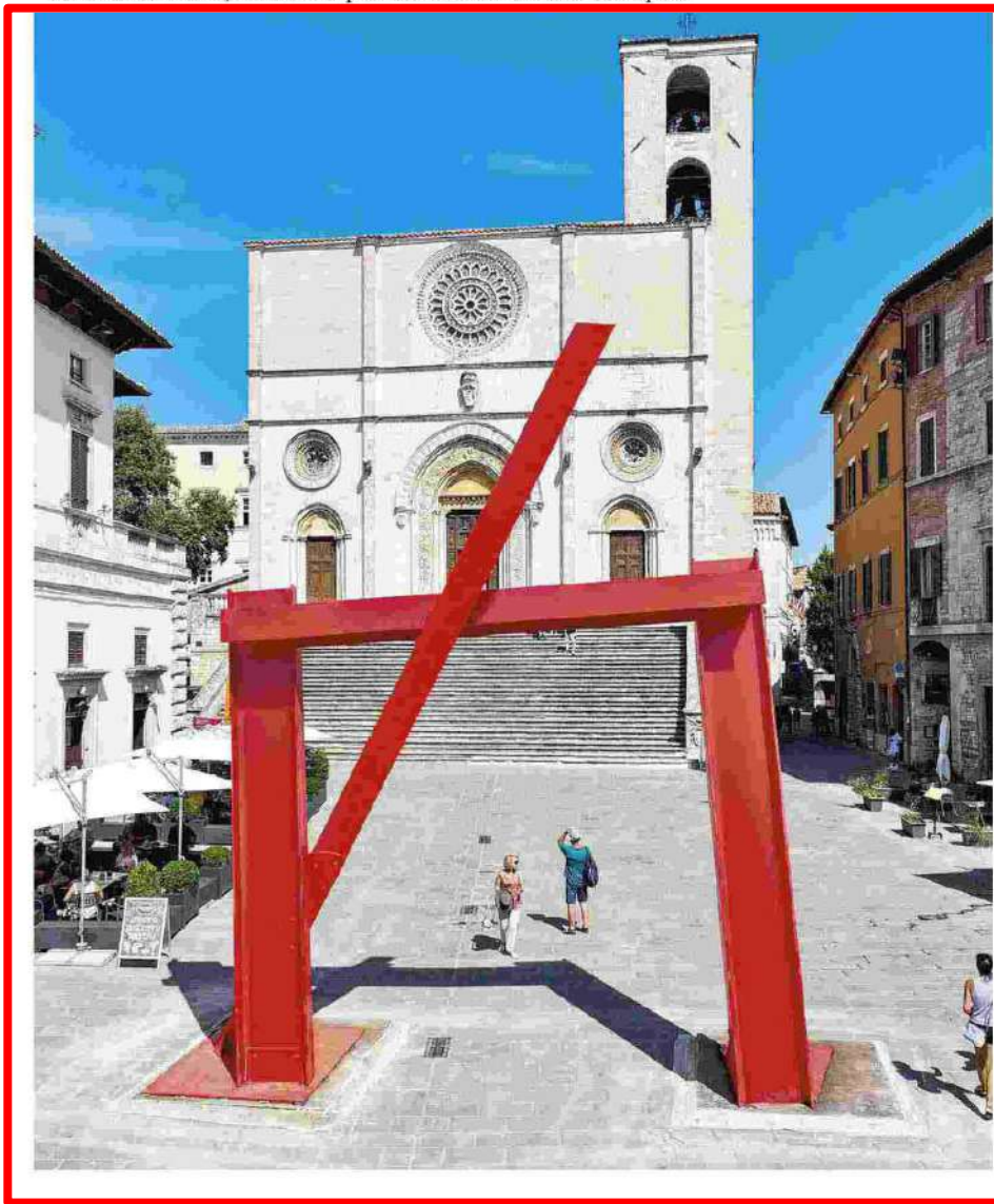
L'opera di Mark di Suvero "Neruda's Gate" (2005) installata nella piazza di Todì